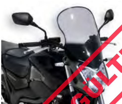
Honda NC 750 S