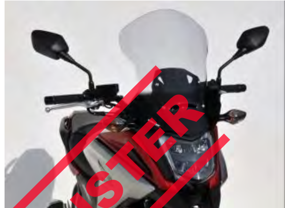
Honda NC 750 X