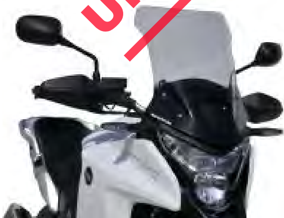
Honda VFR 1200 X Crosstourer