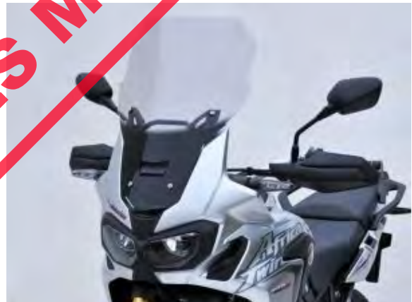
Honda CRF 1000 L Africa Twin