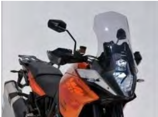
KTM 1190 Adventure