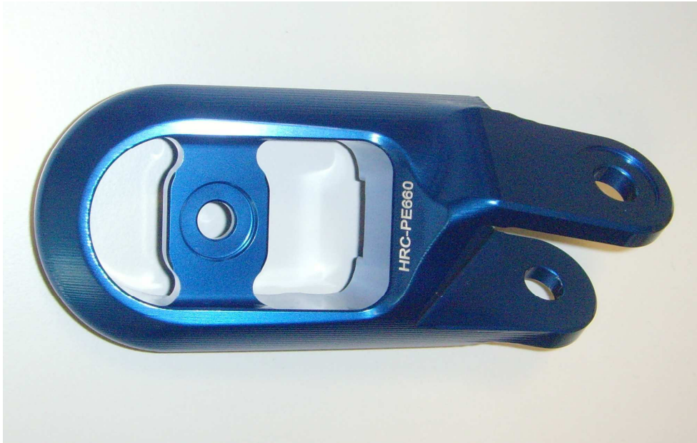
Austauschraste, Ausführung HRC PE660