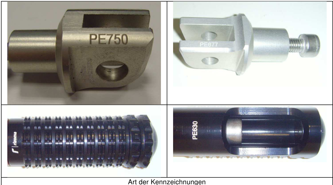
Art der Kennzeichnungen