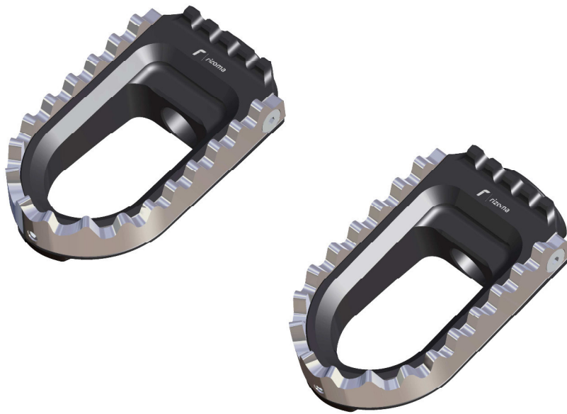
Austauschraste, Ausführung PE640