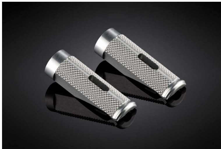
Austauschraste, Ausführung PE614