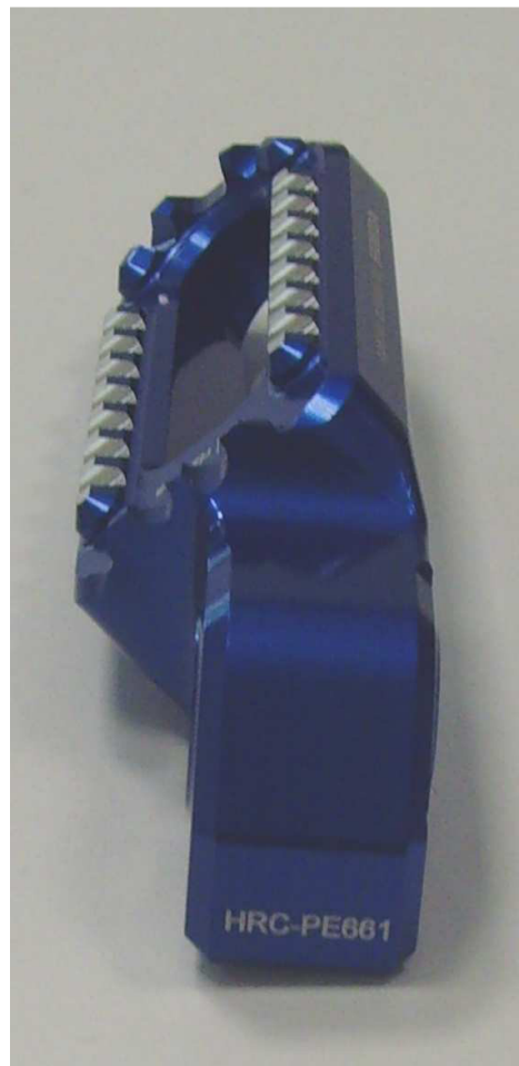
Austauschraste, Ausführung HRC PE661