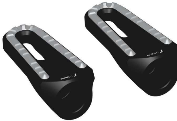
Austauschraste, Ausführung PE642