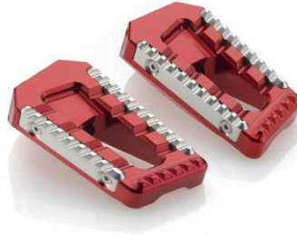
Austauschraste, Ausführung PE622