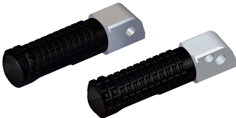
Austauschraste, Ausführung PE127